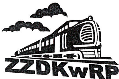
Wzór Nr 1. Logo czarno-białe