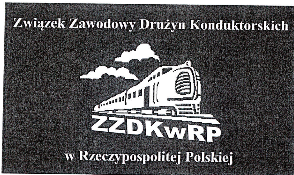
Wzór Nr 1. Flaga ZZDKwRP - wzór ogólny