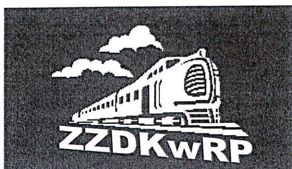
Wzór Nr 3. Logo kolorowe