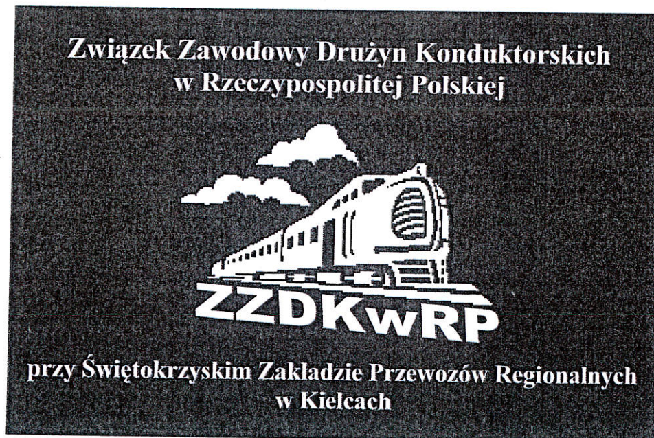
Wzór Nr 2. Flaga ZZDKwRP - wzór miejscowy.